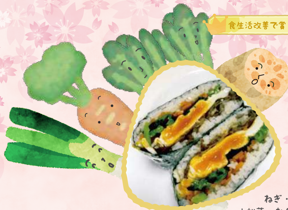
ねぎ・人参 小松菜・れんこん

生姜の甘酢漬けにお寿司についてくる生姜を使い大きめに切ってアクセントにしました。