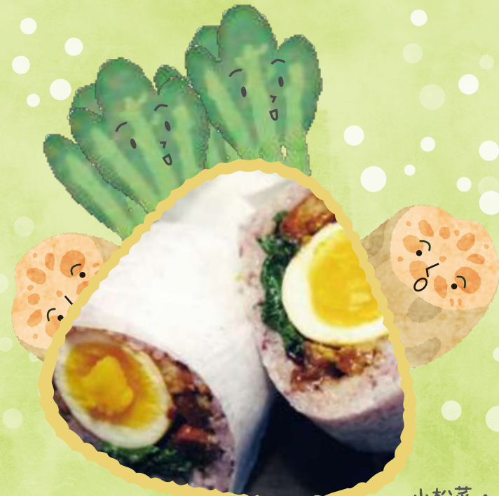
小松菜・れんこん

下のれんこんはにんじん畑とほうれん草畑をイメージしています。 大地に広がる畑と花々がいつまでもたえることの無いことを、 このおむすびに願いました。ピックは大地を見守ってる人です。