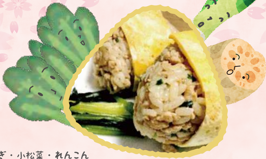
ねぎ・小松菜・れんこん