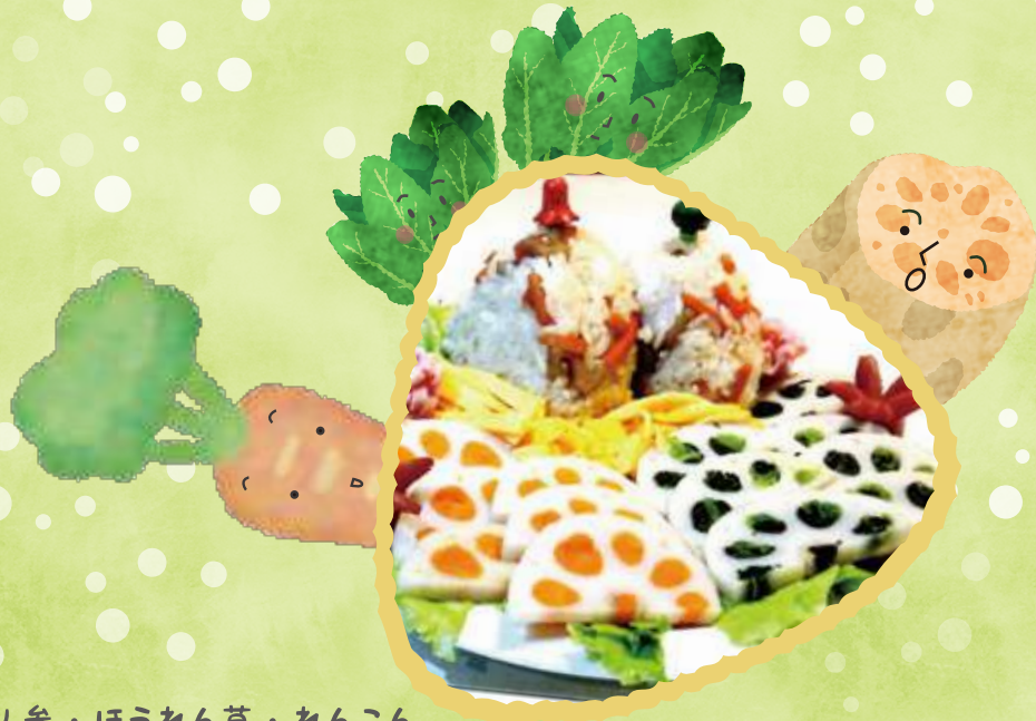
人参・ほうれん草・れんこん